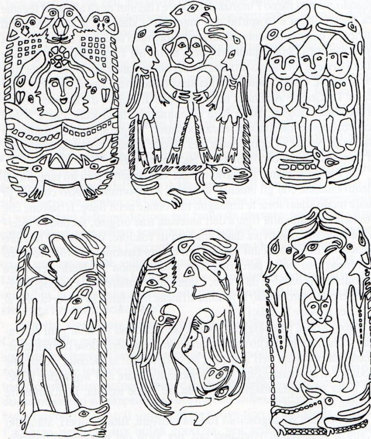
ПОЛЕТ ШАМАНА ИЗ НИЖНЕГО МИРА (ЛЩЕР) В ВЕРХНИЙ МИР К НЕБЕСНЫМ ЖЕНЩИНАМ-ЛОСИХАМ. Голова шамана всегда украшена изображением морды лосихи

raffigurato con due ali, oppure con un'ala e un braccio, a simboleggiare il suo viaggio attraverso tutti i regni dell'universo 10 .